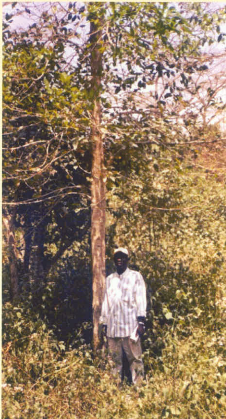
Fût d'un Irvingia de 10 ans