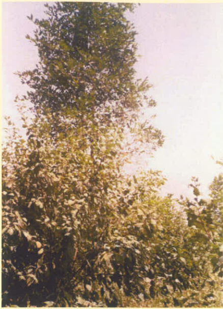
Houppier d'un Irvingia gabonensis de 10 ans en plantation