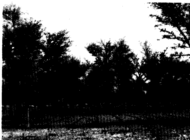
Photo 2. un exemple d'un parc agroforestier dans la région de Zinder (Niger) dominé par de jeunes Faidherbia albida (Chris Reij, juin 2006)