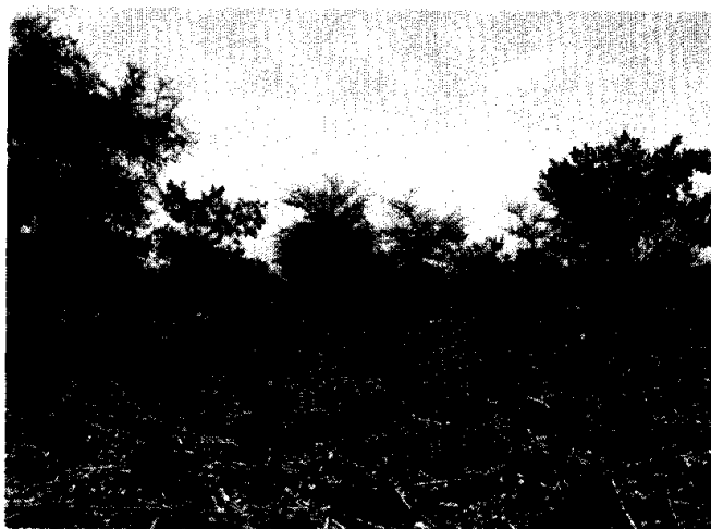
Photo 3. RNA sur les plaines entre le Plateau Dogon et la frontière avec le Burkina (Chris Reij, février 2007)