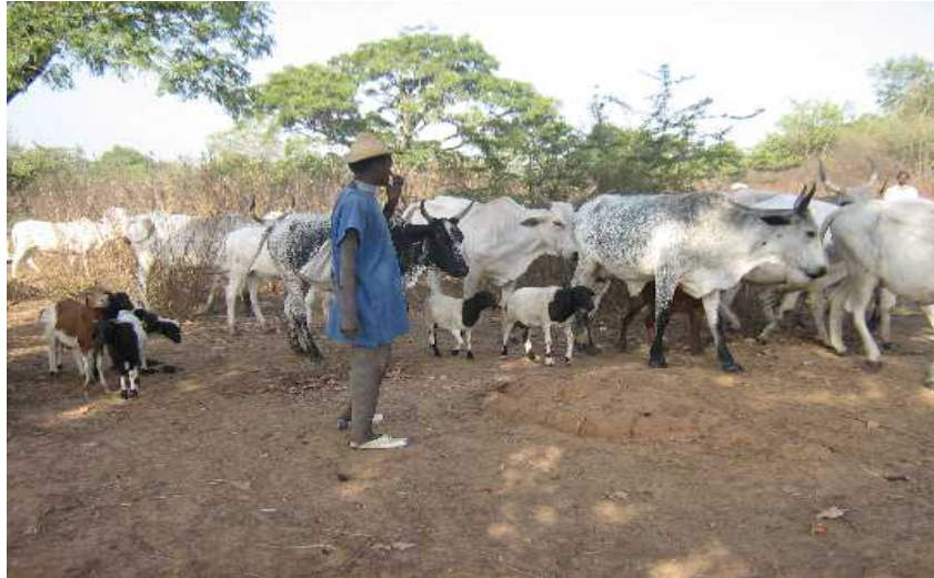
Photo N°3 : Berger Peulh conduisant son bétail s'abreuver à la retenue d'eau de Gah-Guessou (Cliché I.S. 12.10.09)