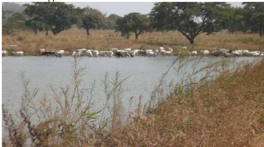
Photo N°4 : Les bœufs s'abreuvent à la retenue d'eau de Diadia ; (Cliché S.M. 12.10.09)