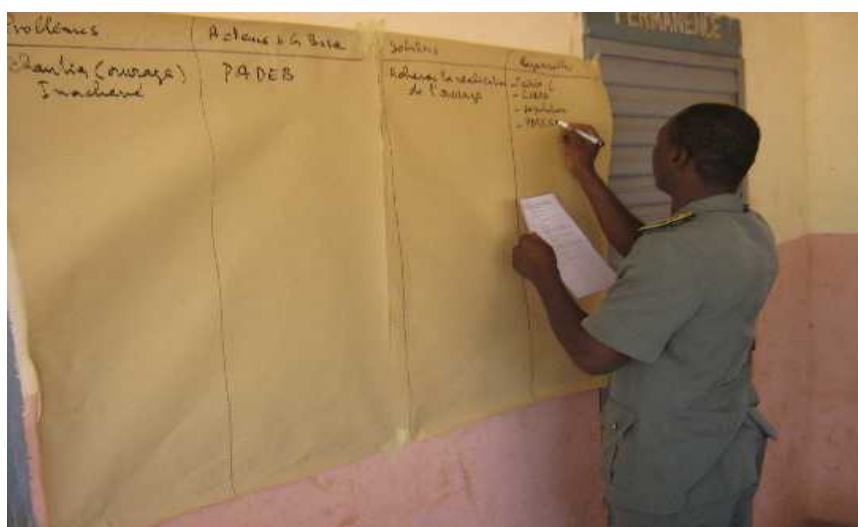
Photo N° 14: Le Chef Service Communal pour la Protection de l'Environnement et de la Nature de Bembèrèkè, rapporteur de son groupe au cours de l'atelier communal; (Cliché S.I. 12.12.09)