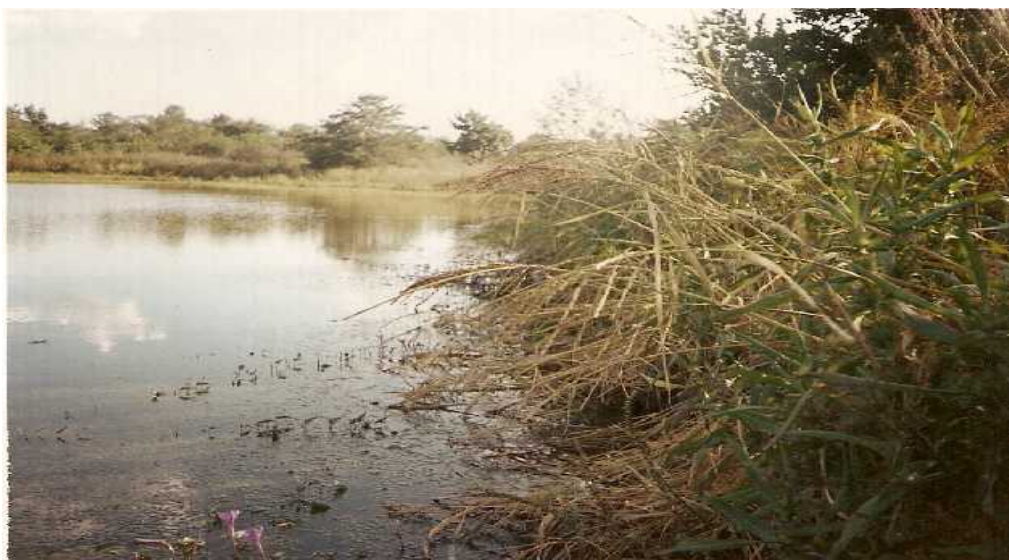
Photo N° 8 : La retenue d'eau de Sombi Kérékou ; on peut remarquer que la digue est herbeuse !