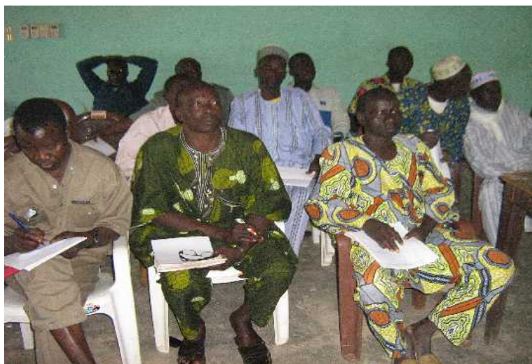
Photo N° 10 : Vue partielle des participants à l'atelier communal de Kandi; (Cliché S.I. 09.12.09) (Sur la photo au premier plan : à droite, le Chef d'arrondissement de Saah, au milieu, celui de Kandi)