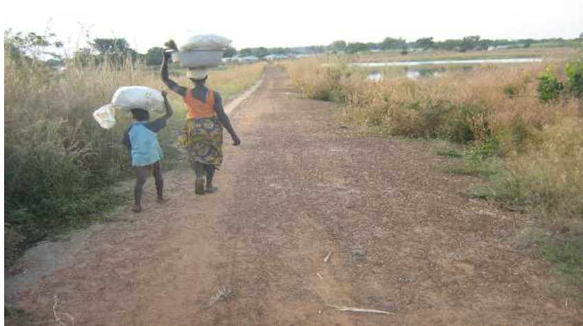
Photo N° 5 : digue utilisée comme voie d'accès sur l'autre rive à Dia dia ; (Cliché S.M. 12.10.09)