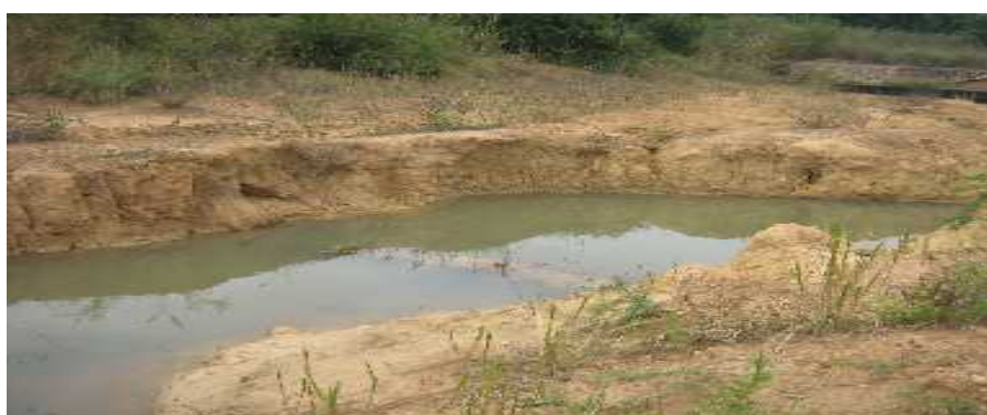
Photo N°1 & 2 : Impacts d'érosion sur le déversoir de la retenue d'eau de Kinkinnindarou