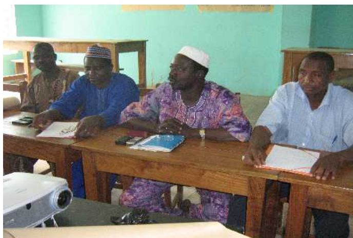
Photo N° 11 : Vue partielle des participants à l'atelier communal de Sinendé; Au centre de la photo, le 1 er Adjoint au Maire et à sa droite, le secrétaire général