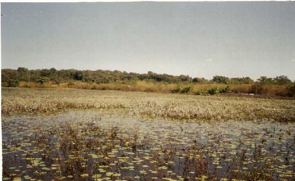
Photo N° 6 : Colonisation de la surface de l'eau par les plantes aquatiques ; (Cliché B.A. 13.10.09)