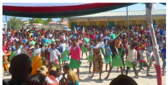
Défilé et danses sur la place du village