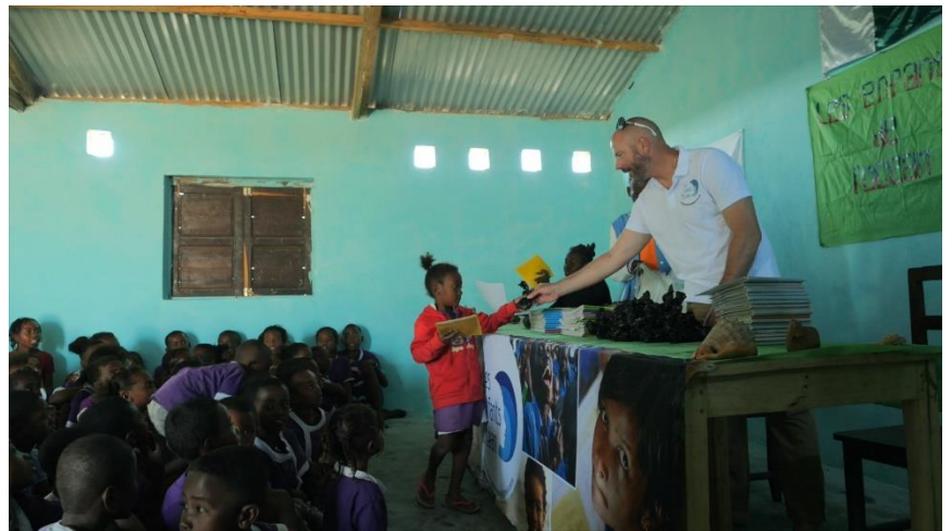
Remise des bulletins scolaires

Il a eu l'occasion de rencontrer le personnel et les élèves.