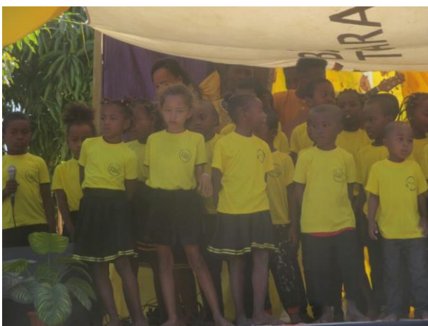
Les élèves chantent et dansent