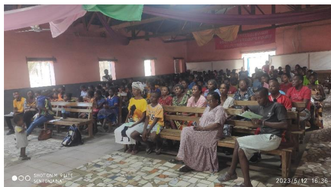
Présence des parents à la remise des bulletins