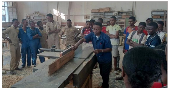
Démonstration dans l'atelier menuiserie