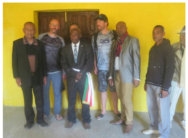
Avec les élus locaux et les responsables administratifs. Au centre : le journaliste pour le reportage.