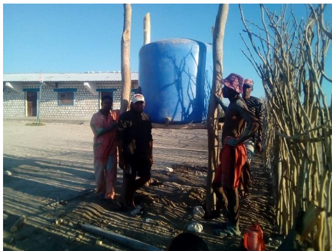
Une meilleure installation du réservoir d'eau