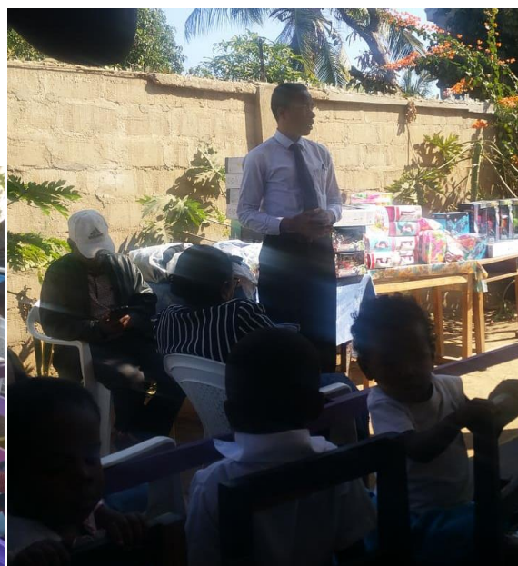
Remise de jouets aux enfants