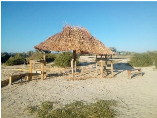
Installation d'un « chalet » dans la cour de l'école à Anakao