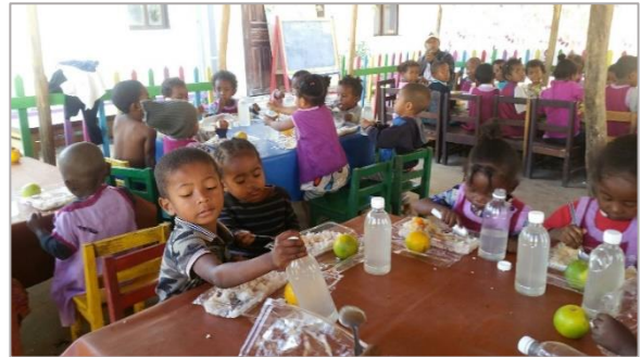
Repas spécial à la crèche-maternelle