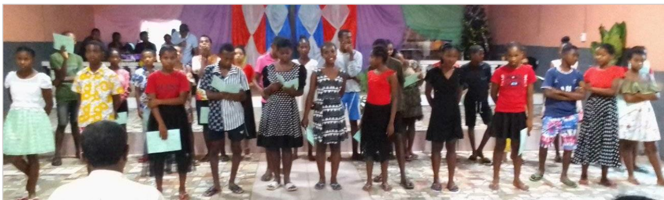
Elèves de 3 ème lors d'une remise de bulletins scolaires

Sur 40 élèves inscrits au brevet, il y a eu 37 admis. On s'en réjouit car on a fait le nécessaire pour rattraper les élèves qui avaient failli redoubler la 4 ème .