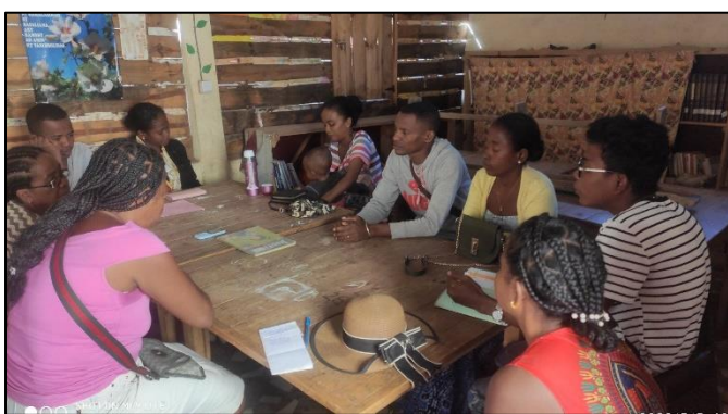
Réunion du personnel de FANARENANA

Il faut parfois réagir devant le manque de travail des élèves ou une conduite qui laisse à désirer.