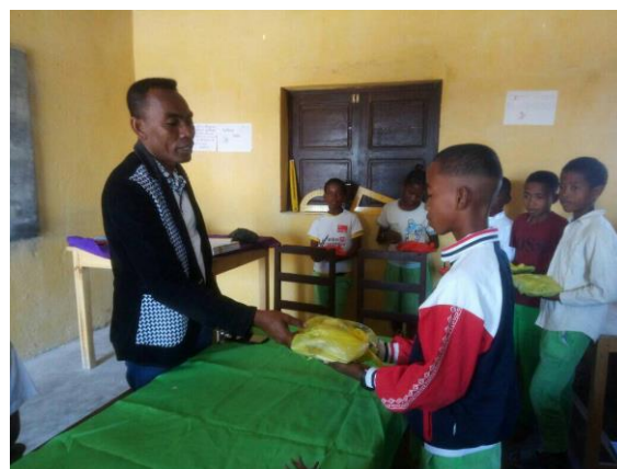
Le maire d'Anakao et les candidats au CEPE

A Andranomena et à St-Augustin, 10 candidats n'ont pas été admis malheureusement.