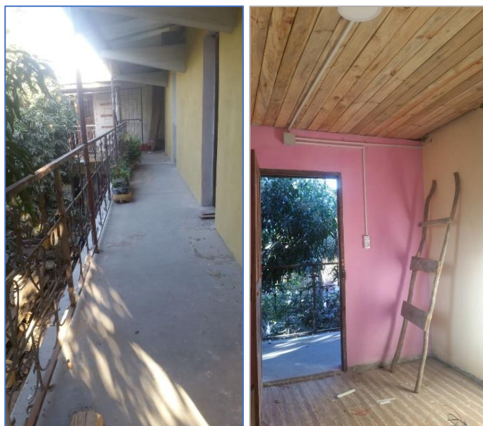
Chambres à l'étage de la maternelle donnant sur une terrasse

Nous nous réjouissons de la fin des travaux à l'étage de l'école maternelle de Besasavy. Les jeunes-filles-mères peuvent maintenant s'y installer. Une grande avancée !