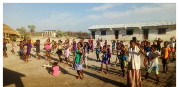
Préparation à la fête du 26 juin

A Anakao , on aime bien participer à la fête de l'Indépendance le 26 juin, tout comme les autres écoles d'ailleurs.