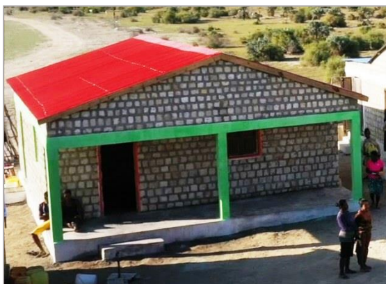
L'espace accueil avec bureau à Anakao

Nous nous réjouissons de la fin des travaux à l'étage de l'école maternelle de Besasavy. Les jeunes-filles-mères peuvent maintenant s'y installer. Une grande avancée !