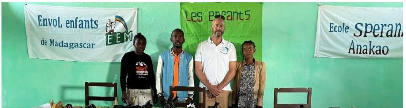
Avec les enseignants de l'école SPERANZA pour la remise des bulletins scolaires