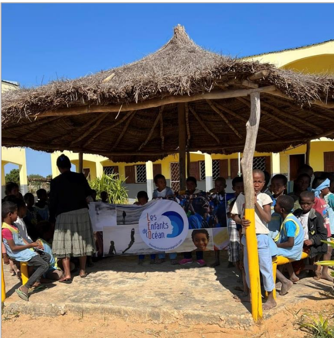
Petite animation sous le « chalet », dans la cour de l'école

L'école d'Andranomena a été la première étape, de la visite du président de LEO, le jour de la fête de l'Indépendance le 26 juillet.