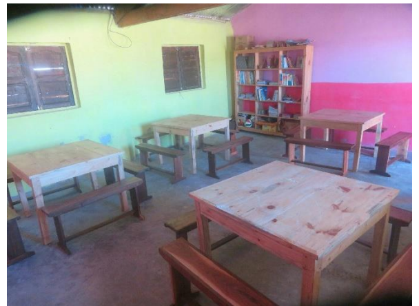
Tables plus adaptées à la bibliothèque

Ainsi cette école peut améliorer l'accueil des élèves au fur et à mesure.