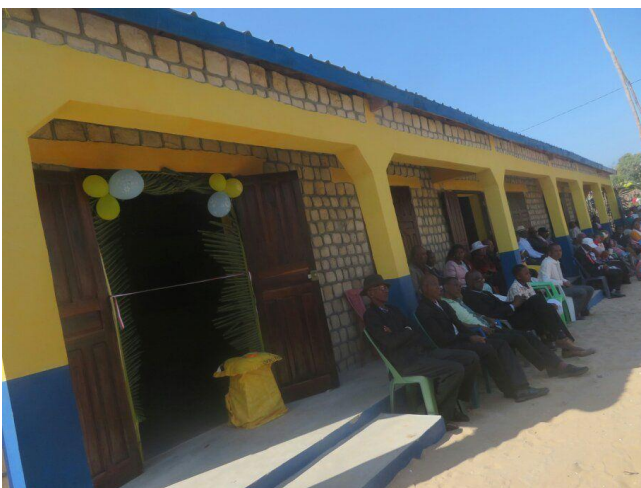
Les autorités locales devant les salles de classe