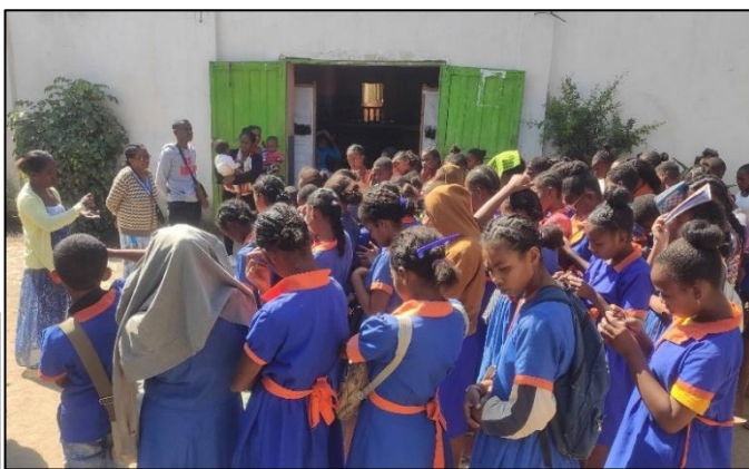
Consignes rappelées aux élèves avant l'entrée en classe