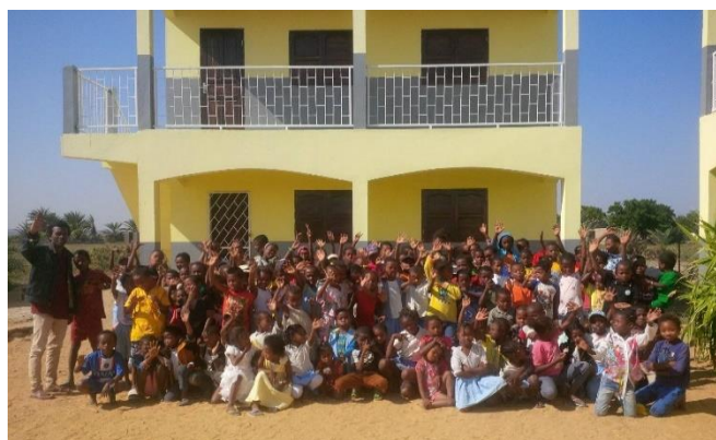
Tous ensemble pour la photo avant de se séparer pour les vacances