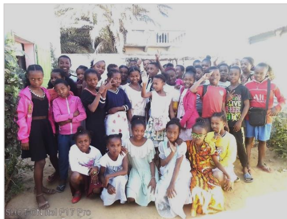
100% de réussite au CEPE à Anakao et à Tuléar-Betania

Sur 40 élèves inscrits au brevet, il y a eu 37 admis. On s'en réjouit car on a fait le nécessaire pour rattraper les élèves qui avaient failli redoubler la 4 ème .