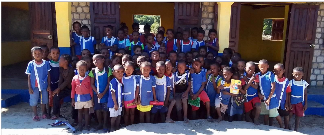
Elèves assidus de St-Augustin devant leurs nouvelles salles de classe