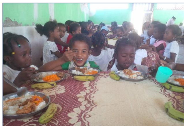
Repas de fête à l'école d'Andranomena

Les enseignants ont mangé avec les élèves qui étaient bien contents de ce repas de fête.