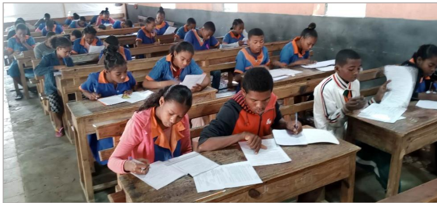
Brevet blanc pour les élèves de 3 ème de FANARENANA

Dans chaque école, il y a une classe de CM2 qui passe le CEPE (Certificat d'études primaires). Les élèves doivent l'avoir pour passer en 6 ème .