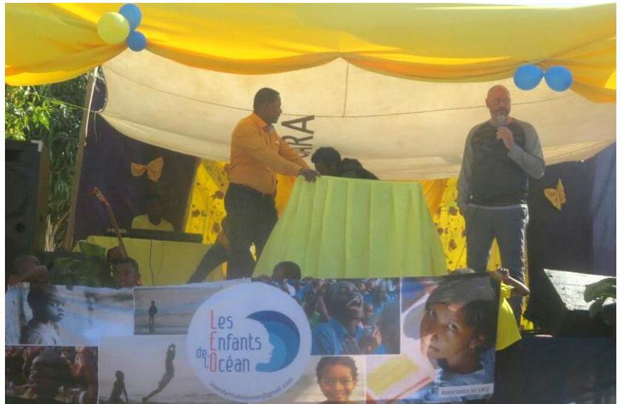
Discours en présence des autorités locales et de la communauté scolaire

On y va en pirogue à partir d'Anakao, ce qui n'est pas une mince affaire.