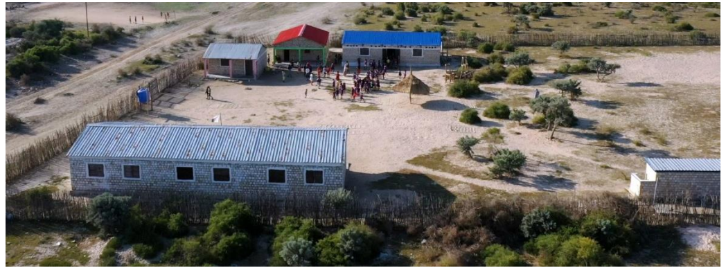
Le site de l'école SPERANZA à l'écart du village

LES ENFANTS DE L'OCEAN y sont concernés par plusieurs constructions.