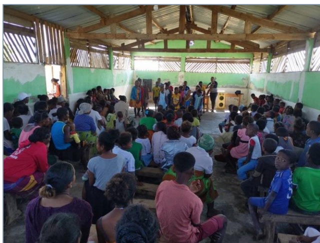
Spectacle d'élèves à Andranomena

A Andranomena, on a organisé un petit spectacle avec les élèves. Les parents invités ont bien apprécié chants et danses de leurs enfants.