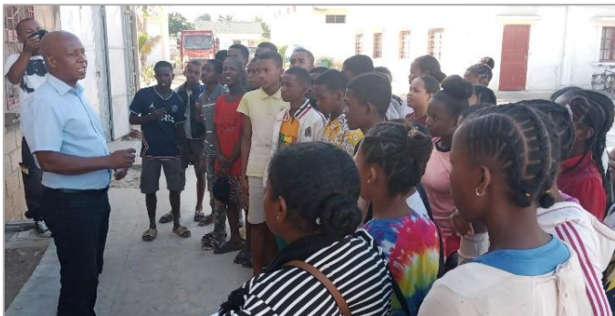
Explications générales sur le centre de formation