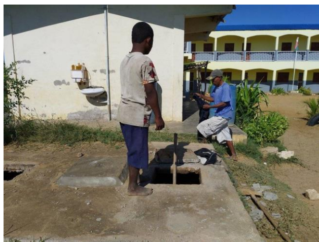
Grosse intervention sur le bloc sanitaire à Andranomena