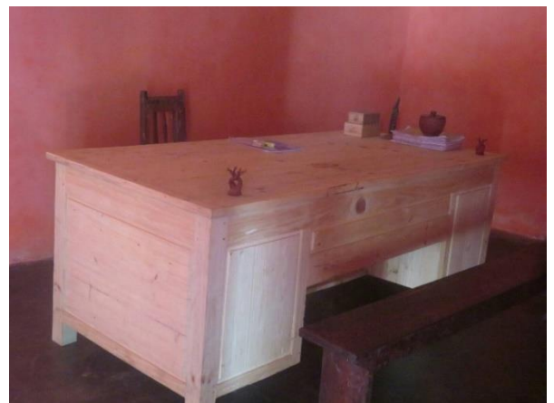
Un bureau pour l'espace accueil