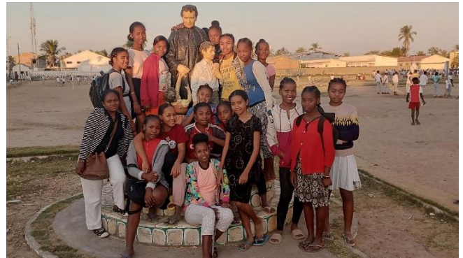
Elèves de 3 ème devant le centre de formation Don Bosco

A FANARENANA, on a emmené les élèves de 3 ème au centre de formation Don Bosco, dans un autre quartier de la ville. Ils ont pu visiter quelques ateliers et se faire une meilleure idée de certains métiers.