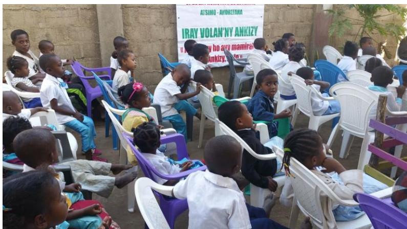
Des enfants bien attentifs

Les élèves de la crèche et de la maternelle ont eu droit à la visite des représentants du Ministère de la Population. On leur a apporté boissons, friandises et jouets (voitures, ustensiles de cuisine)