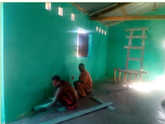
Derniers travaux de peinture à Anakao