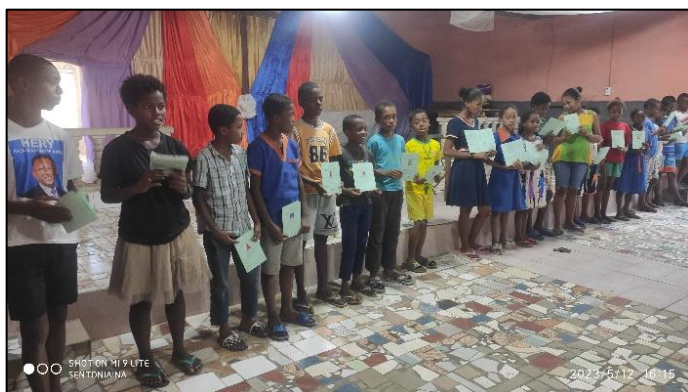
Remise des bulletins scolaires du 3 ème trimestre à FANARENANA

C'est un moment fort du trimestre, avec parfois une petite fête.