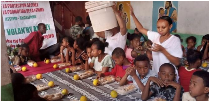
Repas spécial à FANARENANA dans barquettes

Tous les élèves des différents centres restent à la cantine. Dans certains établissements, les élèves ont eu des repas spéciaux offerts par le Ministère de la population et une ONG pendant 3 jours. Ils pouvaient alors déjeuner dans des barquettes.