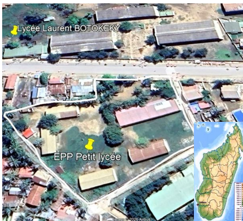
5 bâtiments de l'EPP face au Lycée Botokeky à Toliara (Madagascar)