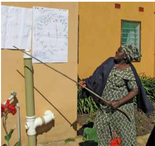
Une femme d'une communauté déclenchée lors de sa présentation, à Chisamba, en Zambie.

Noter sur un tableau à feuilles mobiles ou tout autre support les objectifs de l'atelier. Lisez-les à haute voix et demandez si les participants les comprennent. Demandez s'ils ont besoin de précisions. Faites le lien entre les objectifs et les attentes.