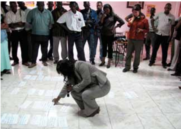
Des formateurs participants classent les fiches des attentes par sujet – au Mozambique.

Facilitez une session participative afin de fixer les normes en matière de comportements et d'interaction, tels que la ponctualité, le fait de ne pas partir avant l'heure, d'éteindre son téléphone portable, de ne pas interrompre les autres et de respecter les durées convenues pour le travail en groupe. Il est donc préférable de désigner des gardiens du temps qui siffleront, frapperont dans leurs mains ou feront d'autres bruits pour signaler le début ou la fin d'une activité et s'assurer que tout le monde respecte le chronogramme.