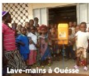
Lave-mains à Ouéssè