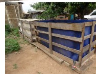
Pisciculture de poisson-chats à Parakou