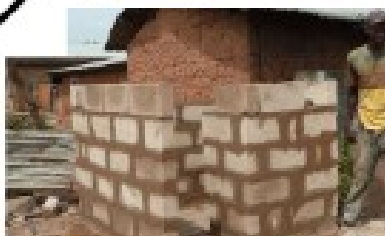
Douche à Ouéssè