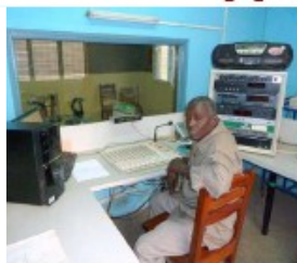
Radio rurale d'Ouèssè