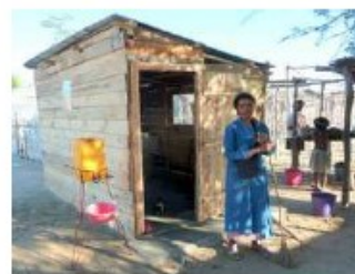
Restaurant de Soalara