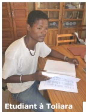
Etudiant à Toliara

Soutien financier (bourse pour le travail de terrain) et encadrement d'étudiants en Master 2 ou de stagiaires de l'Université de Toliara à Madagascar.