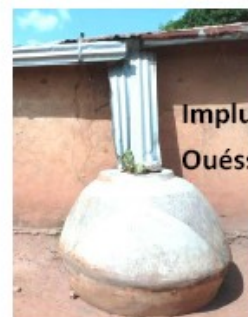
Impluvium à Ouèssè