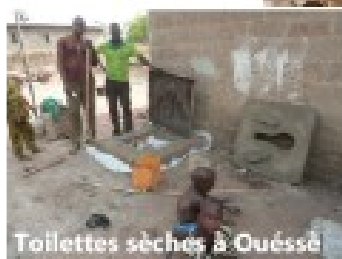
Toilettes sèches à Ouéssè