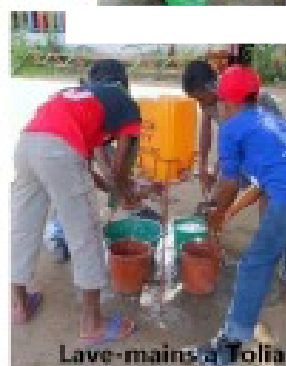
Lave-mains à Toliara