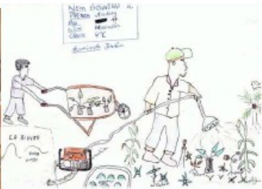
Concours de dessins