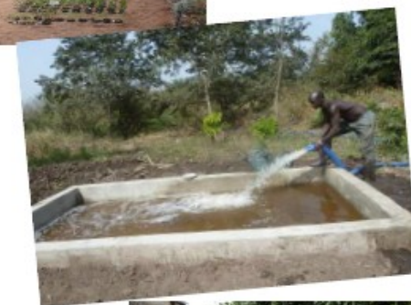
Maraîchage à Ouèssè