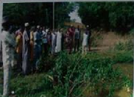
Formation / Renforcement de capacité